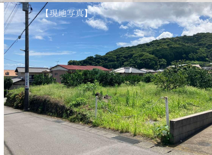
【地図】 熱海市下多賀748-1